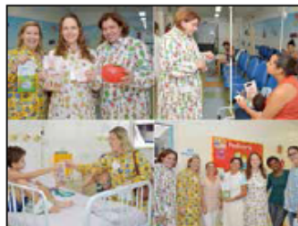
ABO-GO visita o HMI em comemoração ao Dia Mundial da Saúde Bucal