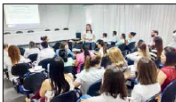
Colaboradores do HMI durante a palestra sobre Saúde Mental

Em grupos, os colaboradores elencaram fatores como a sobrecarga de trabalho, assédio moral, ambiente de trabalho precário e pressão como adversidades que podem intoxicar a rotina