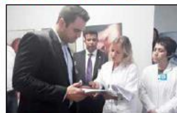
Comissão da Saúde de Alego verifica números de atendimentos no hospital

aquisição dos equipamentos, que são de alta complexidade. E hoje estamos aqui fazendo essa visita para checar os leitos, e com a entrega dos equipamentos vamos dar total condições para o corpo clínico trabalhar", relatou Mandetta. "Vi a situação calamitosa do Materno Infantil, mas não parei um minuto. Leiloei carros de luxo, trabalhamos duramente e aumentamos o atendimento em 50%", completou o governador.