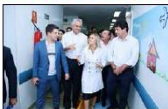
Secretário de Saúde de Goiás, governador e ministro da Saúde visitam o Materno Infantil

O ministro, que na mesma data, juntamente com o governador, inaugurou 55 leitos no Hugol para desafogar o HMI, lembrou que assim que Ronaldo Caiado tomou posse, entrou em contato com ele relatando a situação na qual encontrou a unidade. "Após o governador do Estado visitar a unidade do Materno Infantil e me ligar relatando a situação, nós fizemos um planejamento de curto prazo para garantir os recursos para a