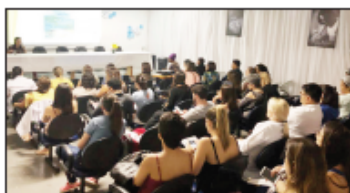
Profissionais discutiram diferentes tipos de violência contra a mulher, crianças e jovens

Também no dia 18, o HMI reuniu profissionais com amplo conhecimento teórico e prático para liderarem um debate sobre violência sexual e de gênero. Com o tema "Proteja nossas crianças e adolescentes da violência", o 2º Simpósio de Violência Sexual e de Gênero, promovido pelo Ambulatório de Apoio às Vítimas de Violência Sexual (AAVVS) da unidade, foi organizado em prol do Dia Nacional do Combate ao Abuso e à Exploração Sexual contra Crianças e Adolescentes, lembrado na data do evento, e ocorreu no auditório da unidade. A palestra de abertura foi ministrada pela pós-doutora em Ciências Humanas, Valeska Zanello, com o tema "Uma leitura gendrada da violência contra mulheres: Dispositivos, cultura e processo de subjetivação".