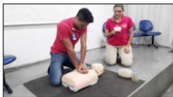
Servidor participa de exercícios de primeiros socorros