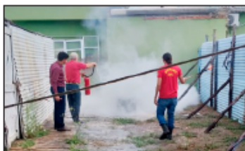
Treinamento prático de combate a incêndio