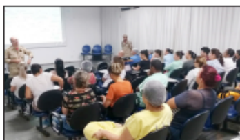
Profissionais do Corpo de Bombeiros aplicam aula teórica

No primeiro dia, o treinamento de "Primeiros Socorros" contou com a participação de profissionais do Corpo de Bombeiros e do Serviço de Atendimento Móvel de Urgência (SAMU). Houve exercícios simulados em manequins, técnicas de mobilização, obstrução e liberação das vias aéreas, compressão cardíaca externa, 'manobra de Heimlich', cuidados com ferimentos, queimaduras e outros acidentes. Já o treinamento de "Combate a Incêndio", foi ministrado exclusivamente por profissionais do Corpo de Bombeiros civil e militar. As aulas teóricas foram realizadas no auditório da unidade e as aulas práticas, no pátio interno. Neste módulo, foram abordados vários assuntos ligados ao tema, como teoria e propagação do fogo, classes de incêndios, prevenção e métodos de extinção do fogo, agentes externos, equi-