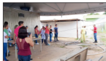
Colaboradores atentos às explicações do Bombeiro

pamentos de combate a incêndio e de proteção individual, além de técnicas de combate a incêndio utilizando o sistema de hidrantes. Na aula prática, os participantes aprenderam a manusear os extintores e hidrantes, bem como os cuidados necessários para acabar com o fogo utilizando os sistemas de combate ao incêndio.