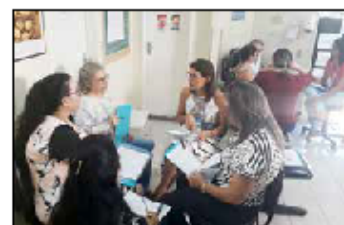
Dinâmica de grupo ajuda profissionais no atendimento