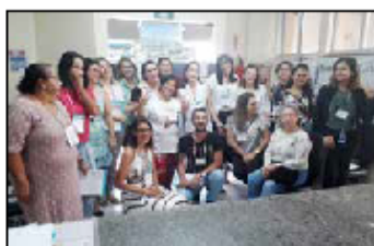
Equipe do BLH com instrutores da capacitação

Essa foi a primeira capacitação realizada pela Secretaria de Estado da Saúde, por meio da Gerência de Saúde da Mulher, Criança e Adolescente da SPAIS-SES/GO, em parceria com o Comitê Estadual de Incentivo ao Aleitamento Materno de Goiás e a Rede Estadual de Banco de Leite Humano de Goiás. "Os profissionais de saúde são fundamentais na promoção e apoio ao aleitamento materno, e necessitam ter conhecimentos sobre o manejo da ama-