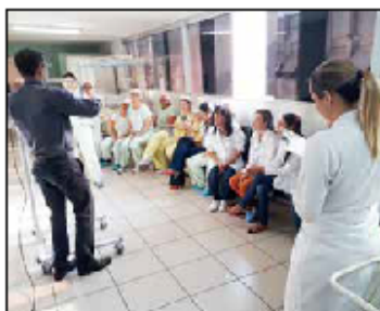
Enfermeiros e médicos foram capacitados em fototerapia

O hospital recebeu 20 aparelhos de fototerapia. O intuito é aprimorar cada vez mais o tratamento oferecido disponibilizando equipamentos moder-