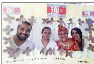
Adorno Zero é a campanha do HMI