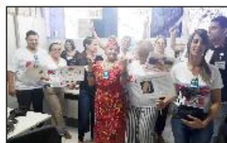
Nada de pulseiras, brincos e outros adornos no hospital

pe do Sesmt e Cipa, fez uma blitz nos setores, de forma bem divertida, com a personagem de Carmem Miranda à frente da campanha. Na oportunidade,