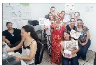
Blitz da campanha Adorno Zero nos setores