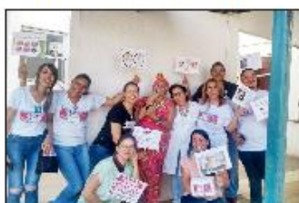
Colaboradores dizem não aos balangandãs