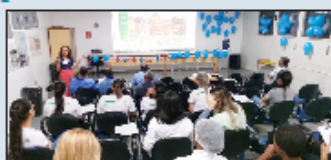
Colaboradores do hospital atentos à palestra

O Hospital promoveu no dia 29 de novembro, no auditório da unidade, a palestra "Cuidar da saúde também é coisa de homem", com a psicóloga Denise Ribeiro, em alusão ao Novembro Azul. A profissional faz parte da sub coordenação da Política da Saúde do Homem - Superintendência de Atenção à Saúde do Estado de Goiás - da Secretaria de Estado da Saúde (SES).