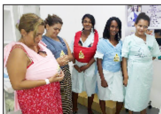
Mamães utilizam o Método Canguru

As mães de bebês prematuros (que nascem com menos de 37 semanas) internados no Hospital puderam receber orientações de como cuidar dos pequenos para favorecer seu desenvolvimento. Uma das técnicas ensinadas foi wrap sling , criada para facilitar o contato pele a pele e favorecer a recuperação dos bebês mais rápido. Além disso, palestras sobre os cuidados humanizados, banco de leite humano do HMI e a importância para os prematuros, o benefício da posição canguru na unidade neonatal, também