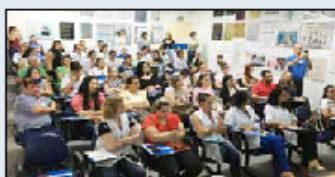
Colaboradores atentos às informações

O evento, criado pelo Ministério da Saúde (MS), teve por objetivo repassar aprimoramentos adquiridos pelos enfermeiros do HMI em cursos