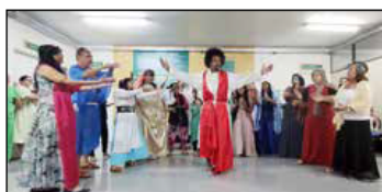
Integrantes do Projeto Cadu realizam cantata de Natal no HMI

Aproximadamente 30 pessoas levaram à unidade toda a história cantada de Jesus Cristo, símbolo do Natal, desde