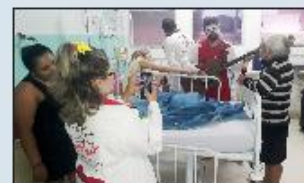
Pacientes e acompanhantes se interagem com o grupo

O grupo Missão Sorriso que atua regularmente no HMI, comandou a diversão e contagiou a todos com sua