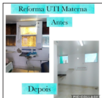
UTI materna revitalizada