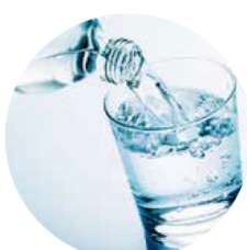
Aumente a hidratação oral