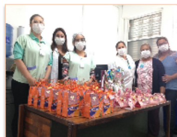
Equipe do Serviço Social e Psicologia do HMI

100 kits de higiene. Essa solidariedade nos permitiu presentear todas as mães", ressaltou.