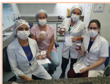
Profissionais se alegram com a homenagem