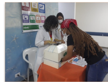
Colaboradora certifica se higienizou bem as mãos