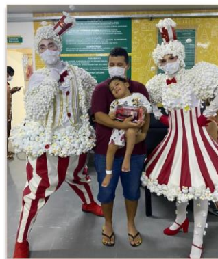
O casal Pipoca garantiu a diversão do Dia das Crianças, com muita alegria