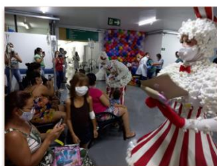
Alegria tomou conta de pacientes e acompanhantes do hospital, que estava todo enfeitado

Com uma decoração especial, painel de balões e tambores e clima de festa no Hospital Estadual Materno-Infantil Dr. Jurandir do Nascimento (HMI), o casal de palhaços Pipoca da Ilumini Personagens Vivos, abriu as comemorações da Semana das Crianças no hospital, no dia 13 de outubro. As crianças da unidade foram surpreendidas com uma festa para comemorar o Dia das Crianças, celebrado no dia 12 de outubro.