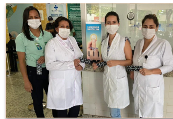
Equipe do NVEH responsável pelas orientações aos pacientes e colaboradores