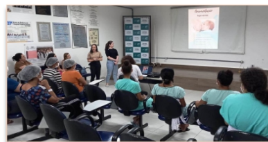
Mães com filhos internados na unidade receberam orientação sobre a importância da amamentação