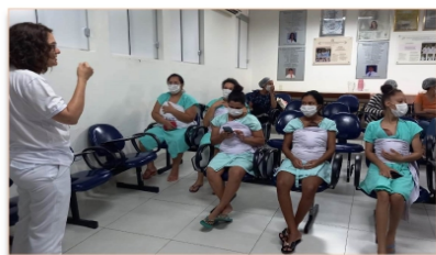
Um dos pilares da prática do Método Canguru é estimular o aleitamento materno

O bebê prematuro, que nasce antes de completar 37 semanas, é biologicamente mais vulnerável do que os nascidos com 37 semanas ou mais de gestação. Devido a sua imaturidade orgânica, muitas vezes, necessitam de cuidados especiais. Para chamar a atenção sobre esses cuidados, o Hospital Estadual da