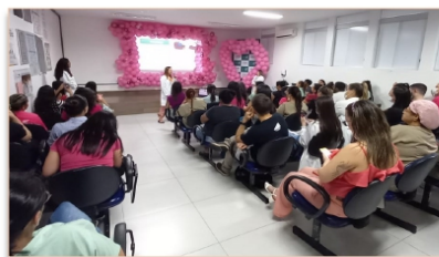
Auditório lotado para palestra sobre o câncer de mama

O câncer de mama é o tipo que mais acomete mulheres em todo o mundo. No Brasil, ocupa a primeira posição em mortalidade por câncer entre as mulheres. Segundo o Instituto Nacional do Câncer (INCA) estima-se que em 2023 ocorrerão 73.610 novos casos de câncer no Brasil.