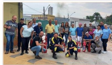
Equipe foi capacitada para saber qual extintor usar em cada situação, minimizando os acidentes