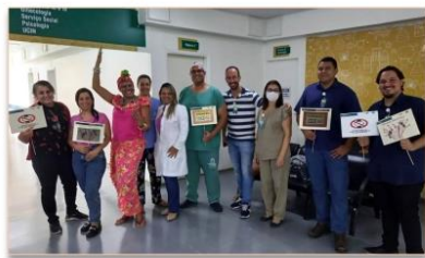
Campanha reforça a proibição do uso de adornos no Hospital, independente de sua função

O uso de acessórios ou adereços no ambiente hospitalar pode comprometer a saúde do paciente, caso estejam contaminados com bactérias ou vírus. Para alertar aos colaboradores sobre o risco de infecção, o Hospital, por meio do Serviço Especializado em Engenharia de Segurança e Medicina do Trabalho (SESMT) e Comissão Interna de